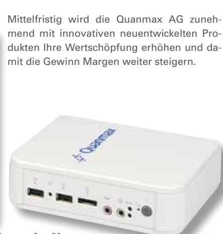
Quanmax Quite PC

Mittelfristig wird die Quanmax AG zunehmend mit innovativen neuentwickelten Produkten Ihre Wertschöpfung erhöhen und damit die Gewinn Margen weiter steigern.